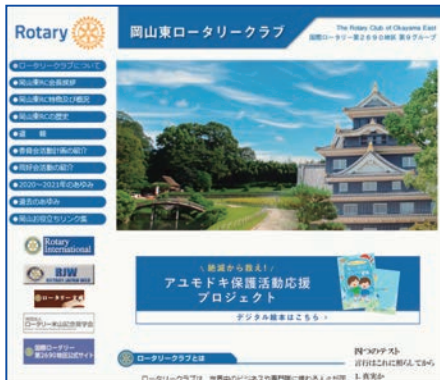
「岡山東ロータリークラブホームページ」

今年度当クラブ社会奉仕(ロータリー財団 地区補助金事業),「絶滅から救え！アユモドキ保護活動応援プロジェクト」事業で作成し寄贈を行いました絵本を, より多くの方に見ていただけるよう,『デジタル絵本』として岡山東ロータリークラブホームページで公開いたしました。会員の皆様にも是非, ホームページへのアクセスよろしくお願い申し上げます。