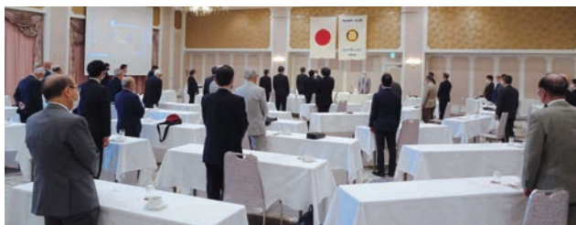
ディスカッション全景