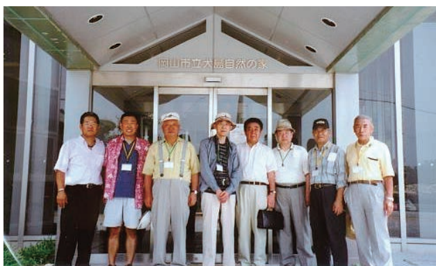
参加会員の皆さん