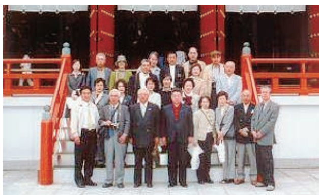
国宝の薬師寺三尊像が安置されている金堂の前にて