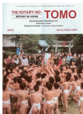
「ロータリーの友」(英語版)の表紙で世界に発信