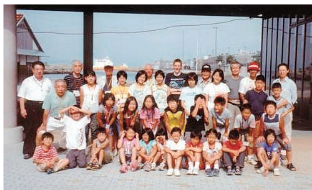
犬島に名残りを惜しんで記念撮影