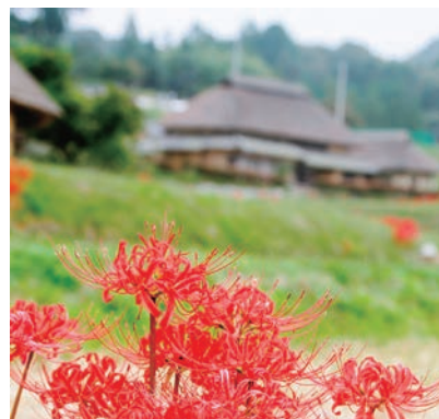
「八塔寺四番」