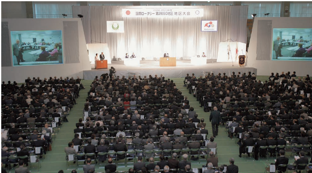
2008-09年度国際ロータリー第2690地区 地区大会 本会議(2008.10.26)

2007年3月2日ガバナーノミニ事務所を開所し、2009年8月31日ガバナー事務所を閉所するまで長いロータリー活動でありました。