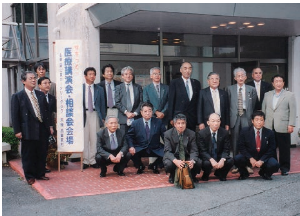
健康づくり「医療講演会・相談会」岡山東 RC 主催、 於 英田郡西粟倉村(2003年(平成15年)9月21日実施)