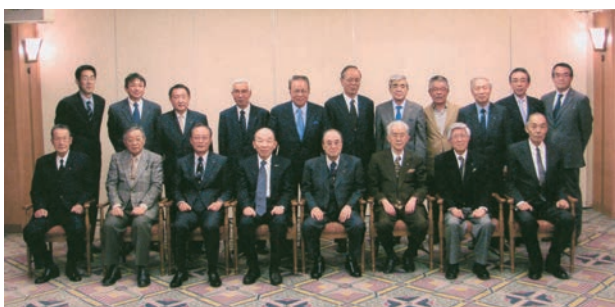
在りし日の砂山先生を偲んで(2008年(平成20年)3月)