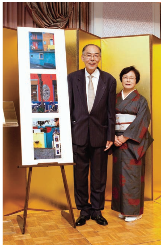
二科会入選おめでとうございます(2011年(平成23年))