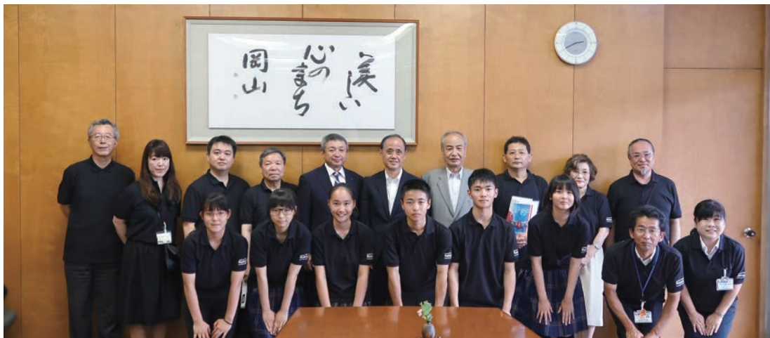
OJO 代表メンバーと共に大森市長と記念撮影