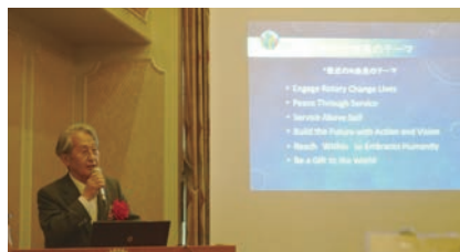
池上ガバナー 講話風景