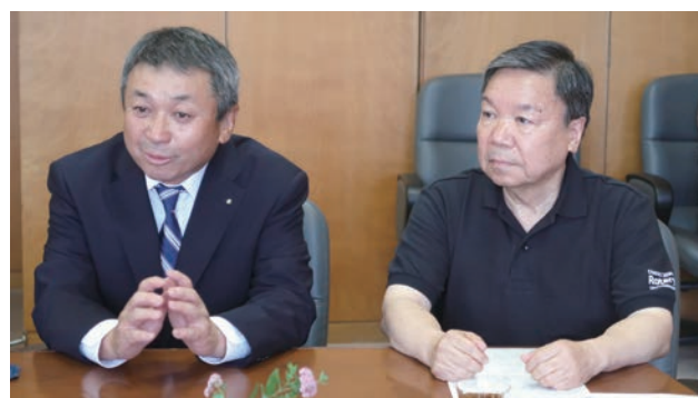
藤井会長、浮田委員長より岡山東RCの支援内容の説明